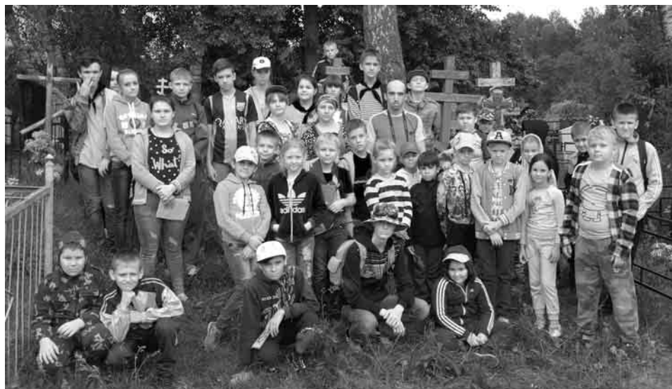
Участники лагеря в походе по памятным местам Великой Отечественной войны (д. Косичино).