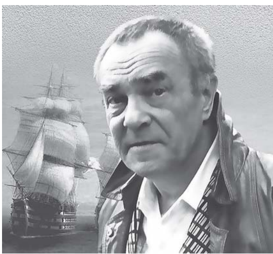
13 июля - 90 лет со дня рождения В.С.Пикуля