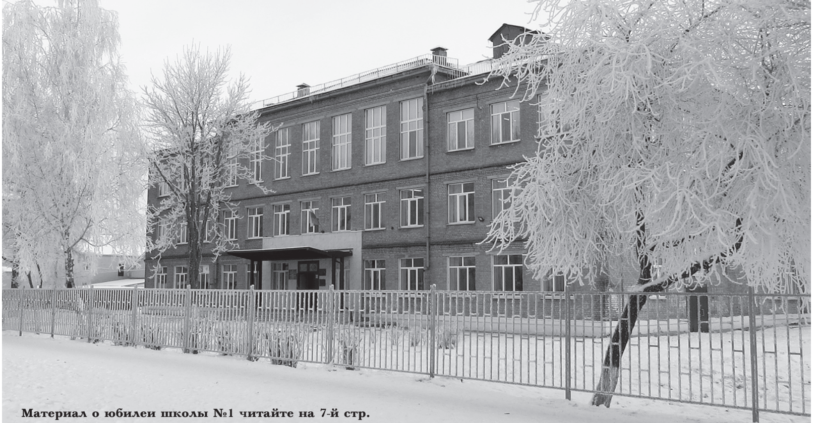
Материал о юбилеи школы №1 читайте на 7-й стр.