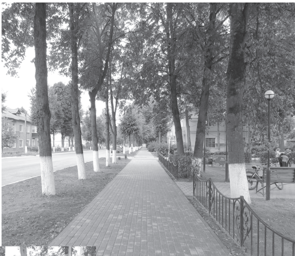
Тротуар на улице Гагарина; топиари в сквере им. М.Б. Чистякова и в сквере им. Ю.А. Гагарина.

Жители Нижнего заметили, что по направлению к заводу появилось новое красивое ограждение. Кстати, оно выполнено в целях безопасности, чтобы переход на другую сторону площади