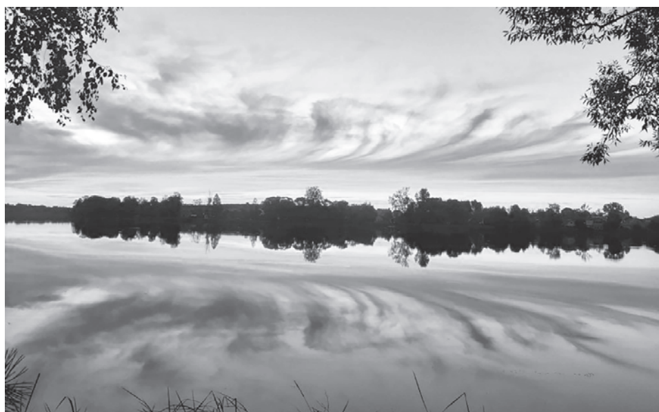
Любимое место нашей семьи - парк "Набережный". Это наше место силы (даже своя лавочка есть). Любуемся закатами, осенью шуршим листочками.