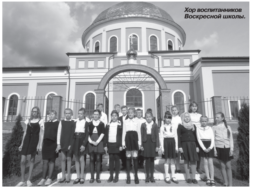
Хор воспитанников Воскресной школы.