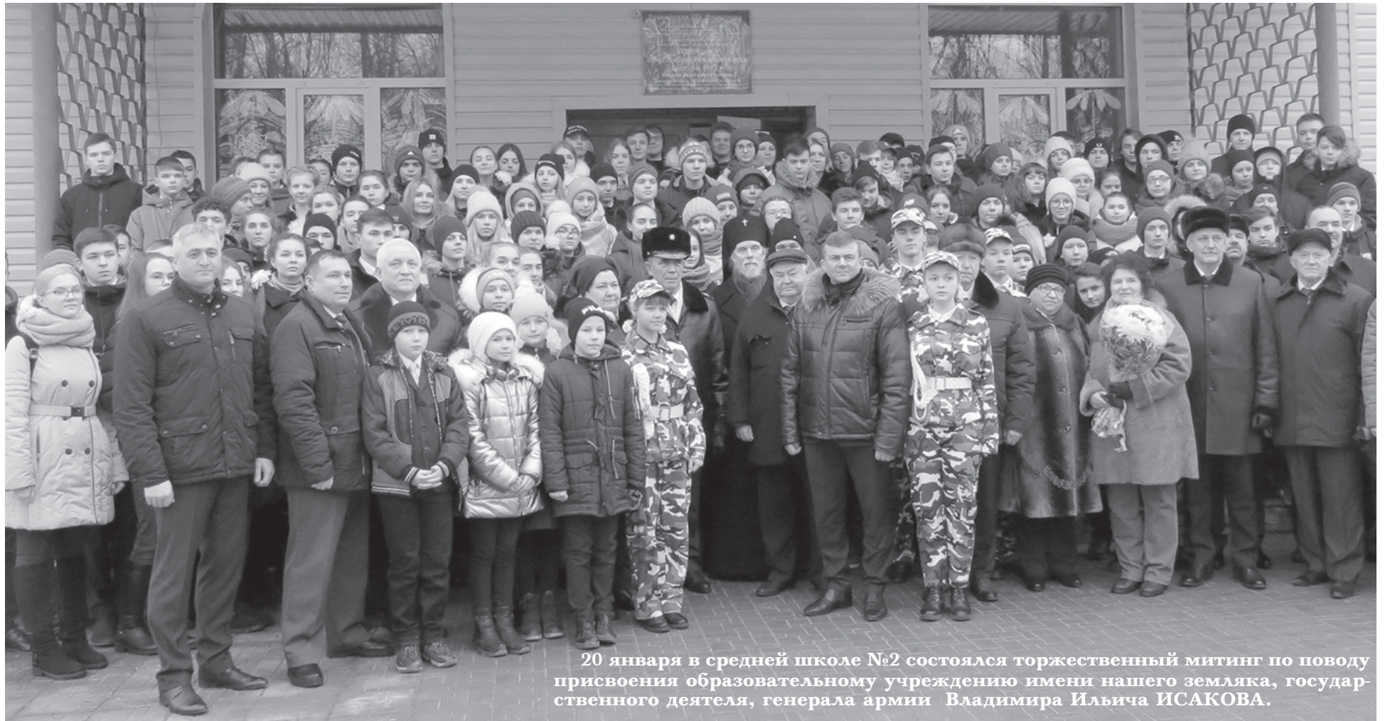
20 января в средней школе №2 состоялся торжественный митинг по поводу присвоения образовательному учреждению имени нашего земляка, государственного деятеля, генерала армии Владимира Ильича ИСАКОВА.