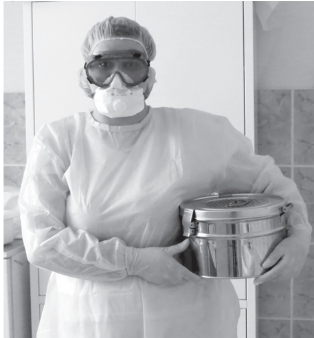
В такой экипировке медицинские работники Центральной межрайонной больницы №1 выезжают на проведение тестов на коронавирус.

Прекращены все плановые обследования, в том числе медосмотры, плановая диспансеризация, санаторно-курортное и восстановительное лечение, кроме пациентов, которые направляются из отделений.