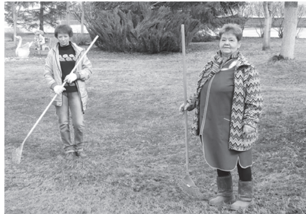
Работники АО "Кировская керамика" приводят в порядок заводскую территорию

В массовых акциях по наведению чистоты примут участие жители всех муниципальных образований - участников онлайн голосования по выбору общественных территорий, которые будут благоустроены в 2022 году. В