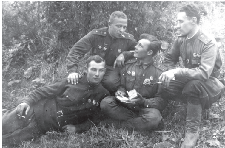
На снимках: Степан Барановский (лежит крайний слева) среди боевых друзей (1943 г.) Памятник на могиле С. Барановского на воинском кладбище на ул.З.Космодемьянской в г. Кирове.

На подмосковном аэродроме Кубинка в торжественной обстановке 28 июня 1943 года лучшему пилоту 162 истребительного полка