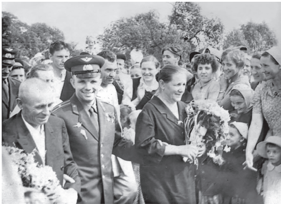
Гагарин с родителями.

12 апреля 1961 года сбылась самая фантастическая и дерзкая мечта челове-