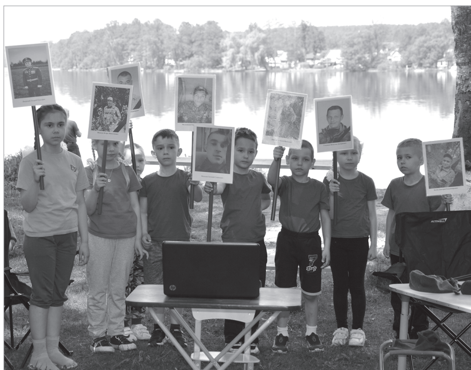
Детский сад №1 "Сказка".