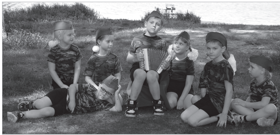
Детский сад №11 "Берёзка".