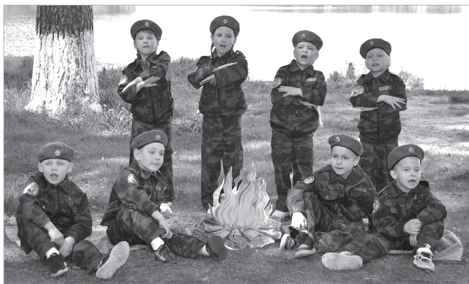
Детский сад №10 "Буратино".