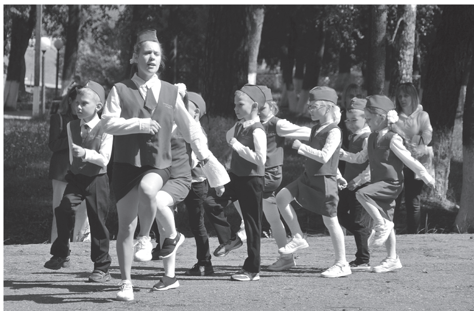
Детский сад №14 "Ручеёк".