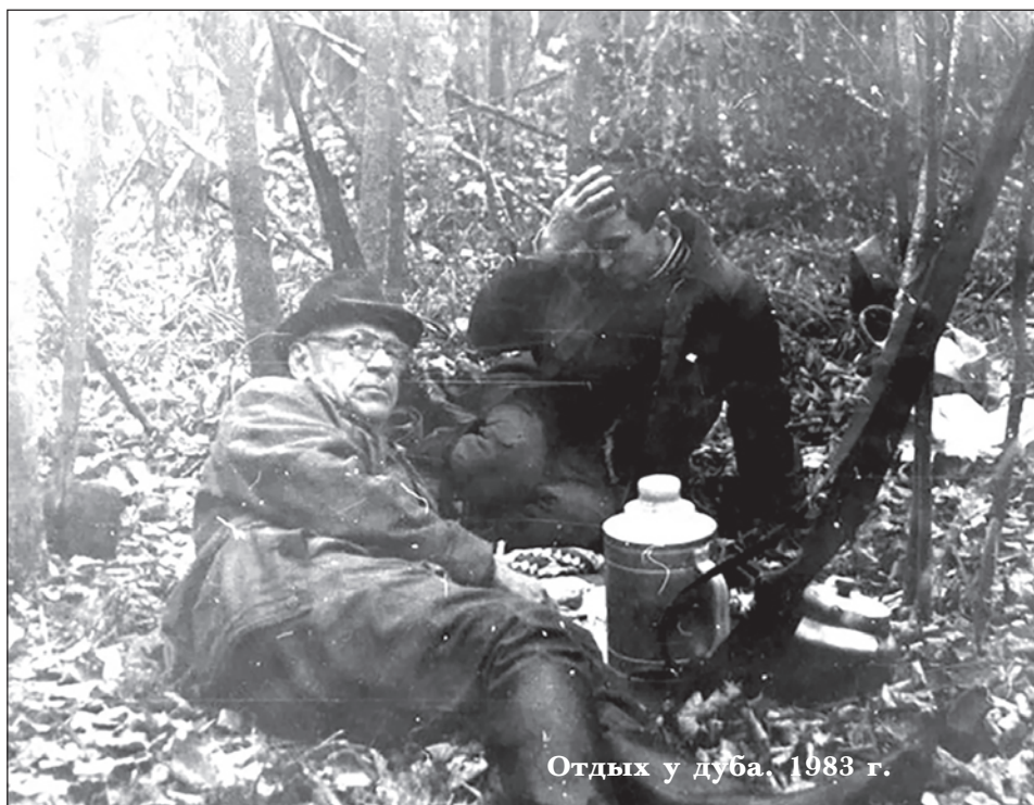
Отдых у дуба, 1983 г.